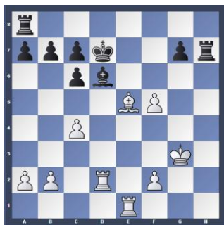
Après 28 coups

1. e4 e5 2. Cf3 Cc6 3. Fb5 Cf6 4. O-O Cxe4 5. d4 Cd6 6. Fxc6 dxc6 7. dxe5 Cf5 8. Dxd8+ Rxd8 9. Cc3 h6 10. Td1+ Re8 11. h3 Fe7 12. Ce2 Ch4 13. Cxh4 Fxh4 14. Fe3 Ff5 15. Cd4 Fh7 16. g4 Fe7 17. Rg2 h5 18. Cf5 Ff8 19. Rf3 Fg6 20. Td2 hxg4+ 21. hxg4 Th3+ 22. Rg2 Th7 23. Rg3 f6 24. Ff4 Fxf5 25. gxh5 fxe5 26. Te1 Fd6 27. Fxe5 Rd7 28. c4